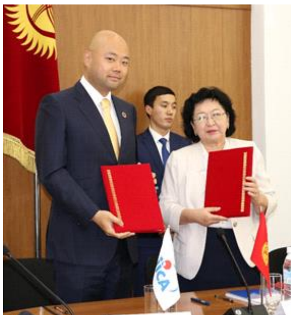
Подписание соглашения по проекту безвозмездной помощи.

17 июля 2019 года в г. Бишкеке постоянный представитель JICA в КР Наюки Нэмото и министр финансов КР Бактыгуль Жеенбаева подписали соглашение по проекту безвозмездной помощи «Реконструкция моста через реку Урмарал на автодороге Талас-Тараз».