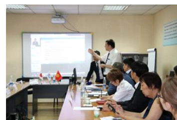
Демонстрация дистанционного обучения.

ГНС. Основной целью проекта является улучшение развития кадрового потенциала ГНС и повышение налоговой грамотности населения посредством внедрения ДО. •