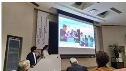
Презентация ОСОП Кыргызстан.

6 июля 2019 года сотрудники проекта «Одно село – один продукт» (ОСОП) и общественного объединения «ОСОП+1» приняли участие на международном форуме «Айдзомэ», организованном университетом Сикоку в префектуре Токусима. Айдзомэ – это традиционная японская краска цвета индиго. Префектура Токусима, расположенная на острове Сикоку, знаменита Awa-Ai, традиционной техникой окрашивания индиго, который