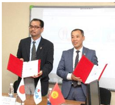
Во время церемонии.

12-го июля 2019 г. в учебном центре ГНС в рамках совместного проекта JICA и Государственной налоговой службы при Правительстве Кыргызской Республики (ГНС) по развитию кадров ГНС, состоялась церемония передачи технического оборудования для